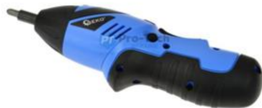
1. Tlačidlo pre vyrovnanie skrutkovača